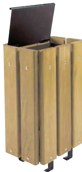
Modèle avec couvercle